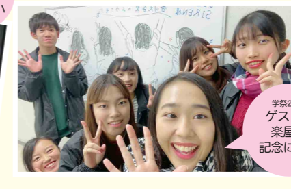
学祭2019 ゲストの楽屋で記念に一枚