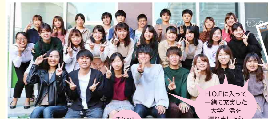
H.O.P.に入って一緒に充実した大学生活を送りましょう