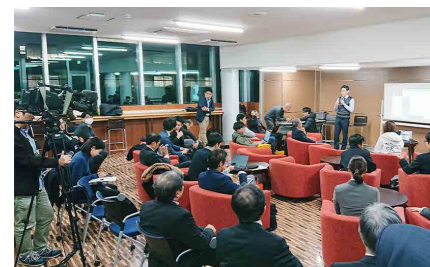
起業部設立記念イベント

香川大学起業部は香川大学生（学部生から大学院生、研究員までを対象）であればどなたでも入部できる大学プロジェクトとして発足しました。各学部では専門性の高い教養や人的ネットワークが身に付く一方で、その知識やアイデアを在学中に活かせる機会は多くありません。多くの研究者と企業との共同研究に学生達も関わり、彼らが在学中に自らの力で何か新たな価値を生む取り組みをしたいという思いを形にできないかと模索する中で、起業部の設立を決意。昨年の12月20日に起業部設立記念イベントを本学にて開催し、入部生達とともに活動の意気込みを披露しました。