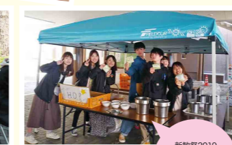
新歓祭2019 お接待うどんをふるまいました