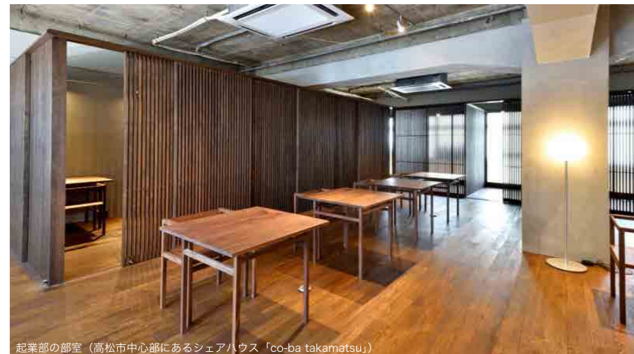
起業部の部室（高松市中心部にあるシェアハウス「co-ba takamatsu」）

起業した学生には、ビジネスモデルを確立できるよう、メンターとともに、金銭的、技術的、ノウハウ的な援助をしていきます。