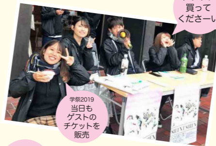
チケット買ってくださーい