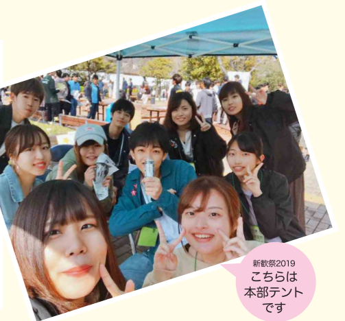
新歓祭2019 こちらは本部テントです