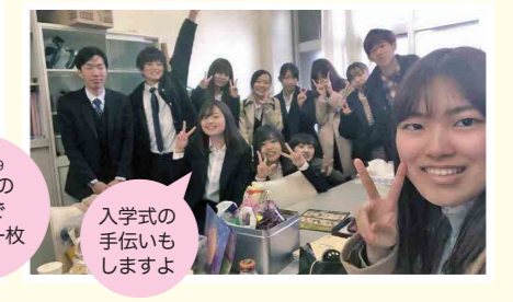
入学の手伝いもしますよ