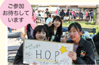
ご参加お待ちしております