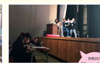
学祭2019 Ms. and Mr. Campusのリハーサル真剣に楽しく