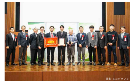
最優秀賞を獲得した香川大学起業部員